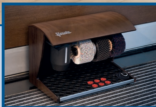
◀ Elégance Nature, vlašský ořech tmavý