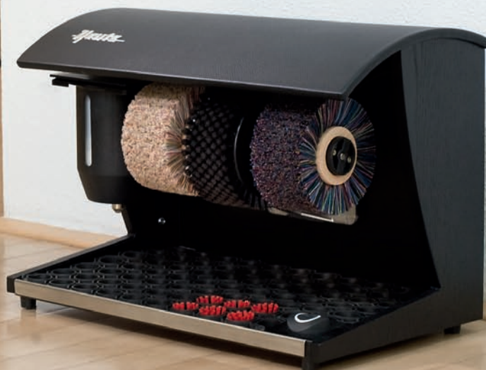
Elégance Nature, černá se zušlechťováním pravé kůže

Stroj na čištění bot Elégance Nature má 3 hlavní specifika, z nichž 2 jsou již obsažena v názvu. Elégance, vzhled připomínající čistou přírodu a menší rozměry.